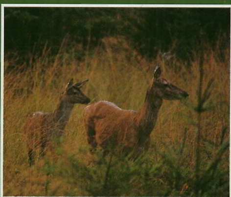
Biche et faon