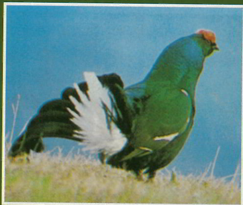
Tétras-lyre (ou petit tétras, ou petit coq de bruyère)