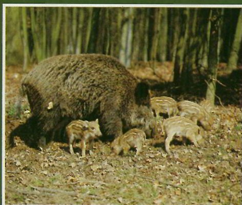
Laie et marcassin