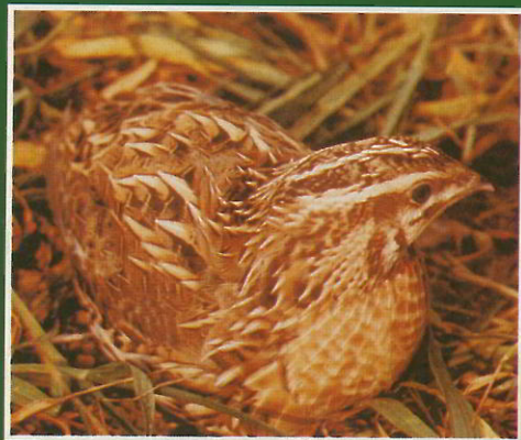
Caille des blés