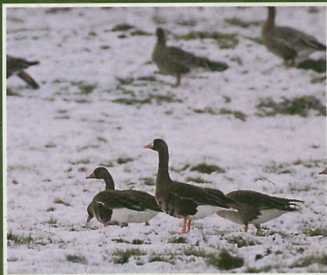
Oie des moissons