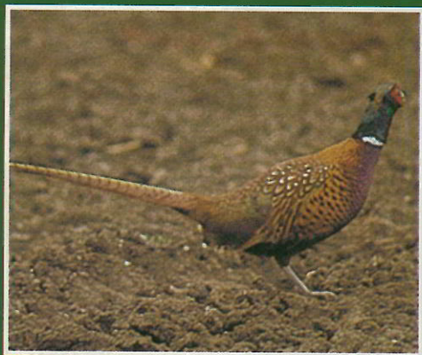
Faisan de chasse