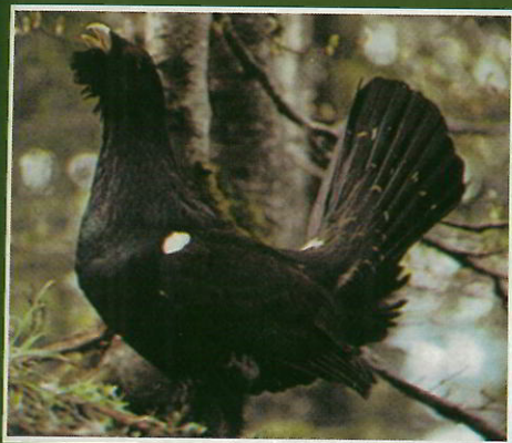
Tétras urogalle (ou grand tétras, ou grand coq de bruyère)