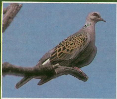
Tourterelle des bois