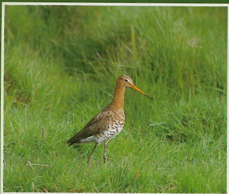
Barge à queue noire