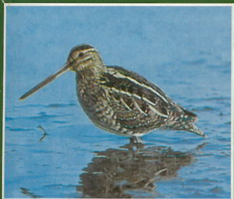
Bécassine des marais