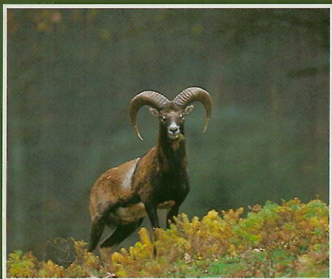
Mouflon de Corse