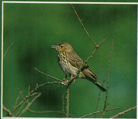
Alouette des champs