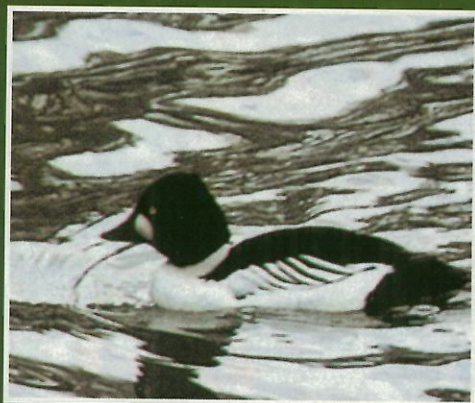
Garrot à œil d'or