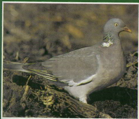
Pigeon ramier (ou palombe)