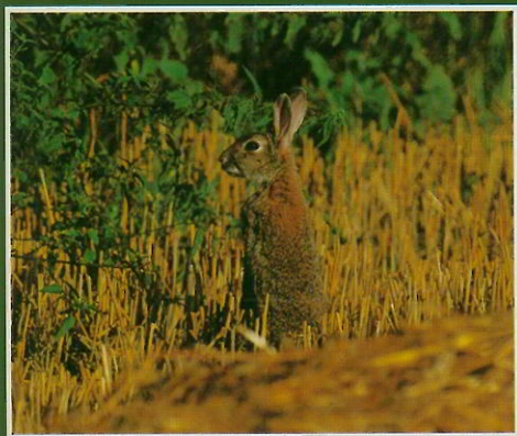
Lapin de garenne