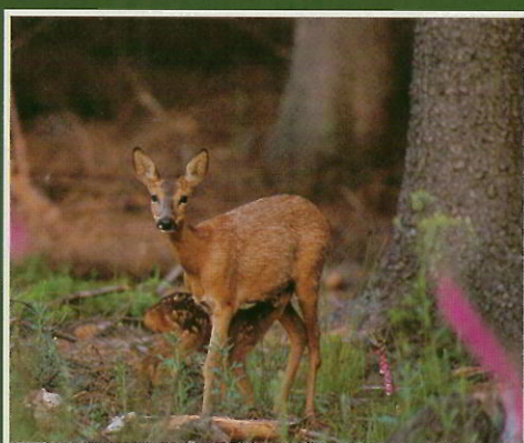
Chevrette et faon