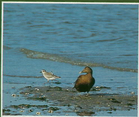
Eider à duvet